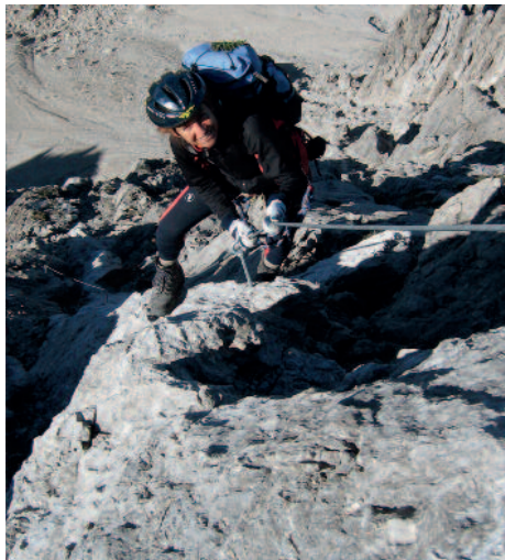
Links im unteren, rechts im oberen Teil vom Wilden Hund